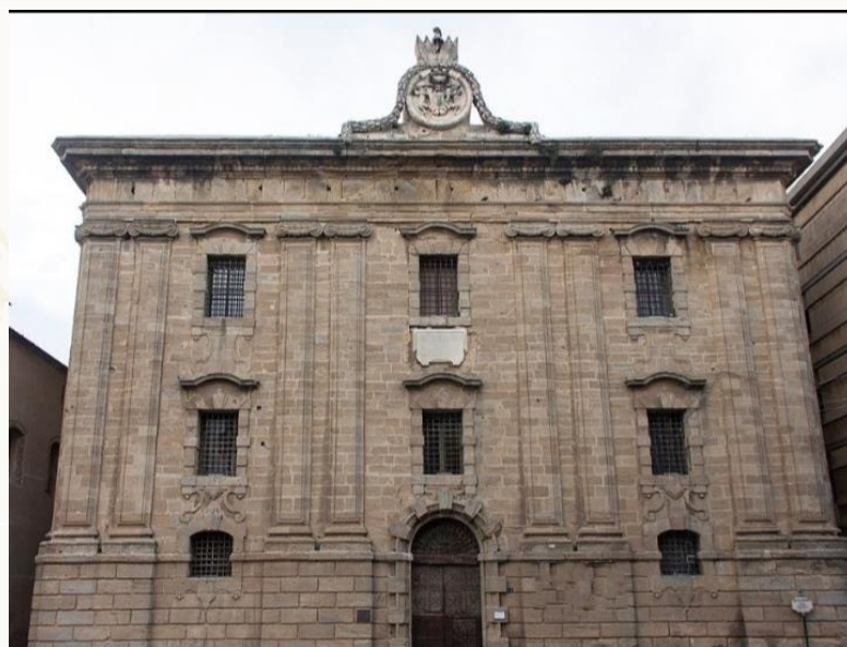
Il Carcere borbonico in cui furono rinchiusi di presunti Giacobini.