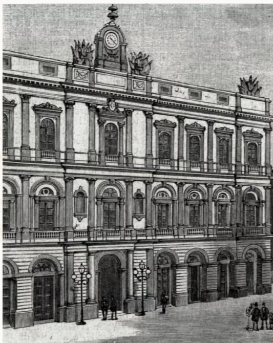
Il palazzo municipale di Caltagirone.

Conosciuta anche per la ricca e pregevole produzione di ceramiche, la città ebbe il maggiore sviluppo tra il XV ed il XVII secolo, con la costruzione di chiese, collegi, conventi, un ospedale e perfino l'Università in cui si insegnava medicina, giurisprudenza e filosofia. Dopo il disastroso terremoto del 1693 che distrusse gran parte delle città della Sicilia orientale, Caltagirone rinacque nello splendore del Barocco e si arricchì di sontuosi edifici, pubblici e privati.