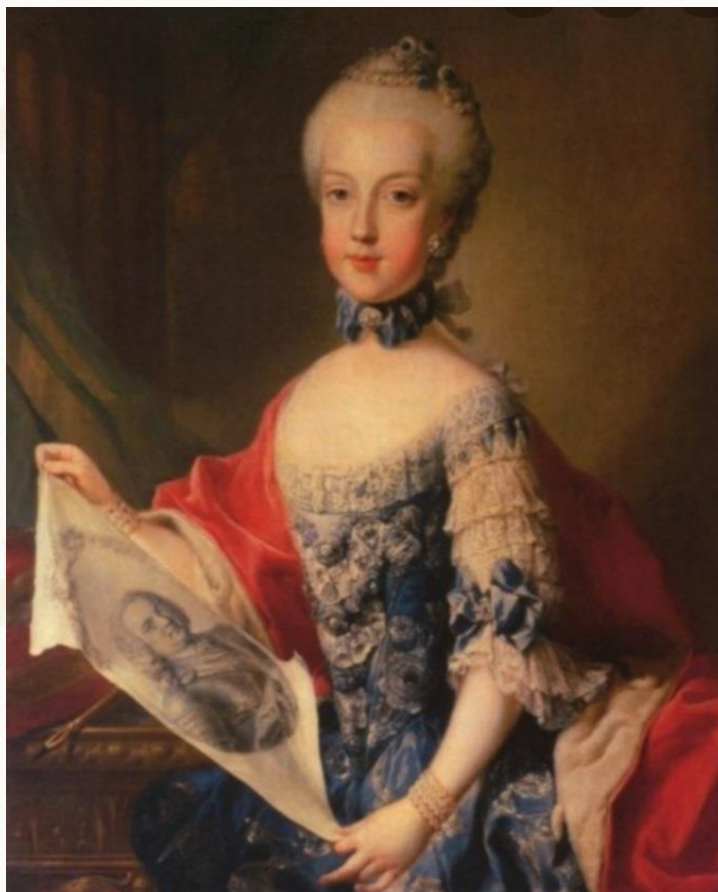
Maria Carolina regina consorte di Napoli e Sicilia.

rimane quella che il “Gran Personaggio” possa essere stato la Regina Maria Carolina di Napoli. Relegata a Palermo insieme al marito, Re Ferdinando IV, e quasi ostaggio degli interessi inglesi, con le sue trame cercò di porre freno, in tutti i modi a lei possibili, alla forza invisibile di quelle “idee” che a Parigi avevano trascinato sulla ghigliottina la sorella Maria Antonietta e ora mettevano a repentaglio anche il suo fragile regno.