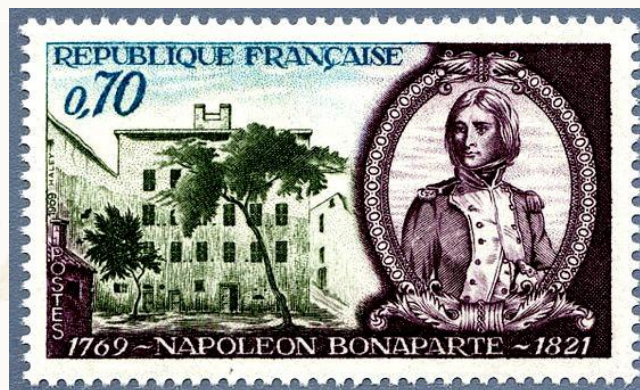
Figura 3 - FRANCIA MORTE DI NAPOLEONE.