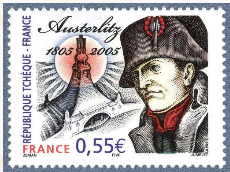
Figura 5 - NAPOLEONE PRESIDENTE DELLA REPUBBLICA.