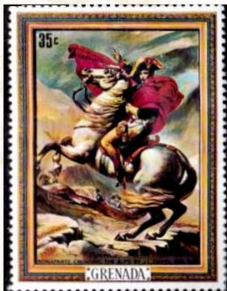
Figura 8 - GRENADA ALTRA IMMAGINE DI NAPOLEONE.