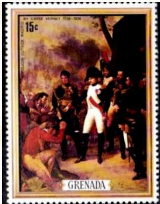
FIGURA 7 - GRENADA IMMAGINE DI NAPOLEONE.