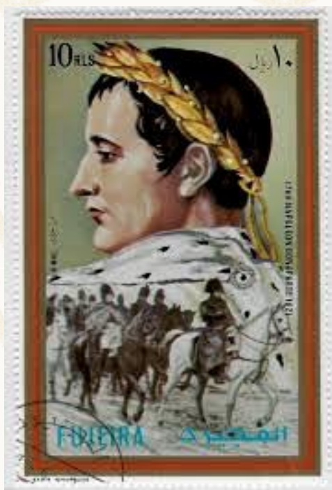
Figura 6 - NAPOLEONE IMPERATORE.