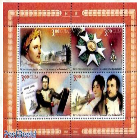
Figura 1 - CUBA IMMAGINI DI NAPOLEONE.

Cari Amici e Lettori, ecco una nuova puntata, la seconda dove inizieremo con singoli valori.