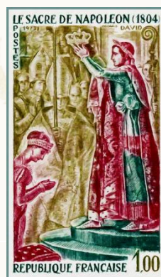
Figura 4 - FRANCIA INCORONAZIONE.