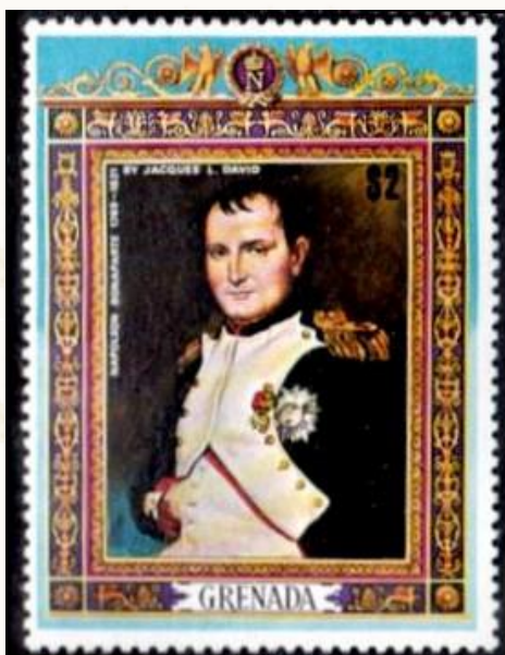
Figura 9 - GRENADA COME SOPRA.