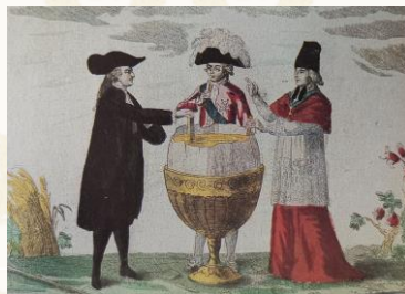
"Uovo alla coque", simbolo di una posizione molto ambita.