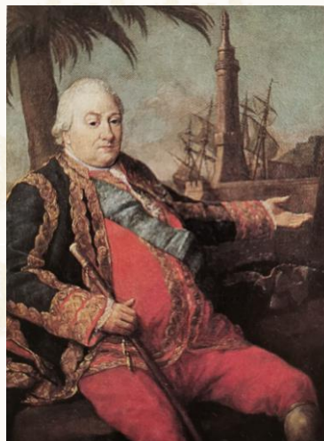
Il balivo Suffren.